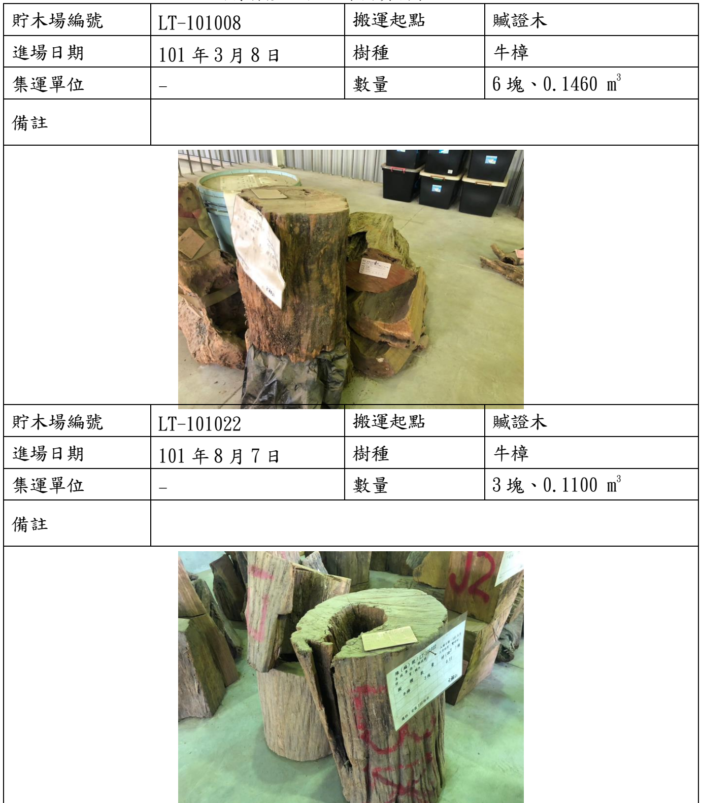
國有林產物拍照錄檔資料表