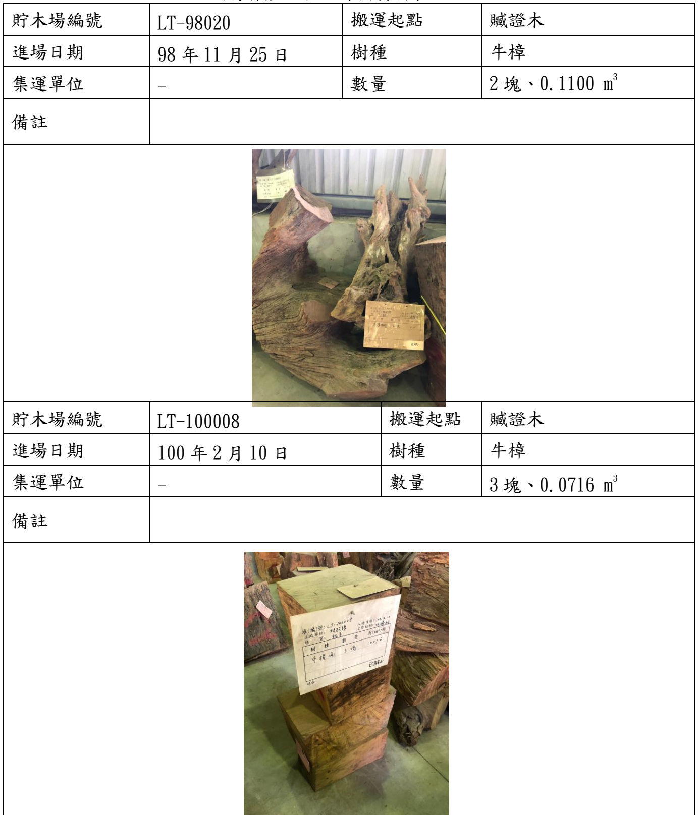
國有林產物拍照錄檔資料表