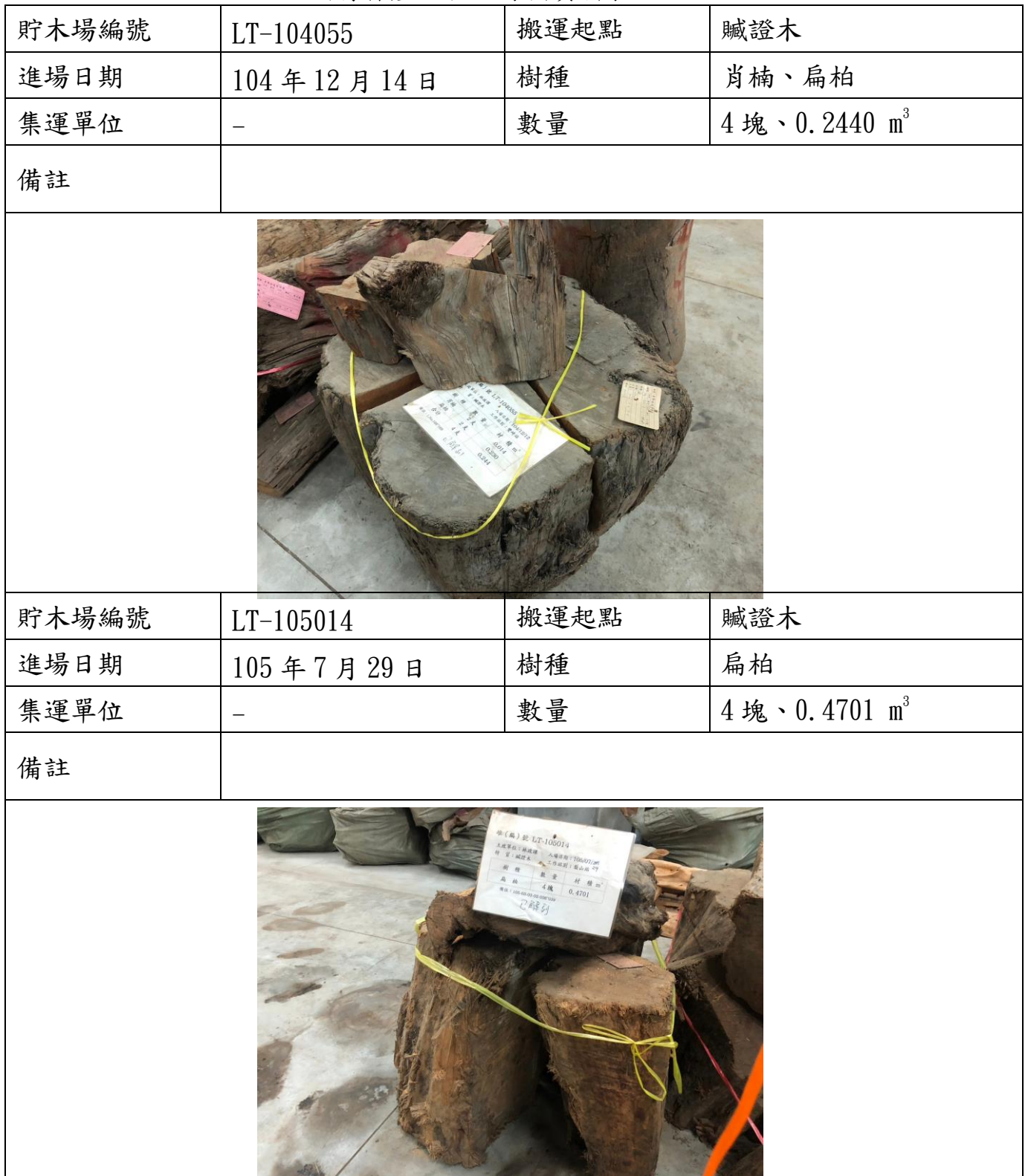
國有林產物拍照錄檔資料表