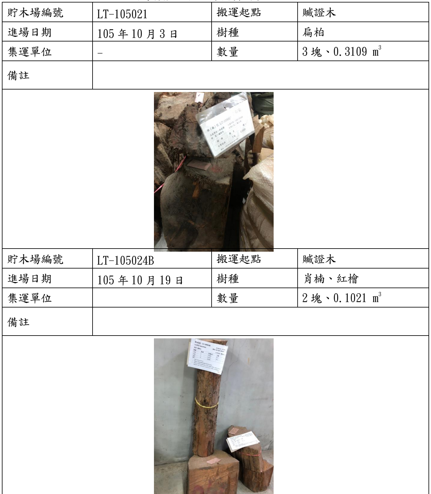
國有林產物拍照錄檔資料表