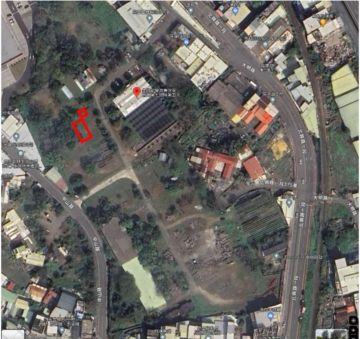
地點：新竹分署竹東貯木場