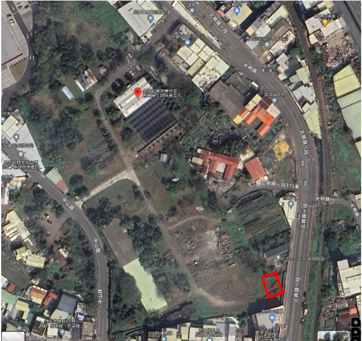
地點：新竹分署竹東貯木場