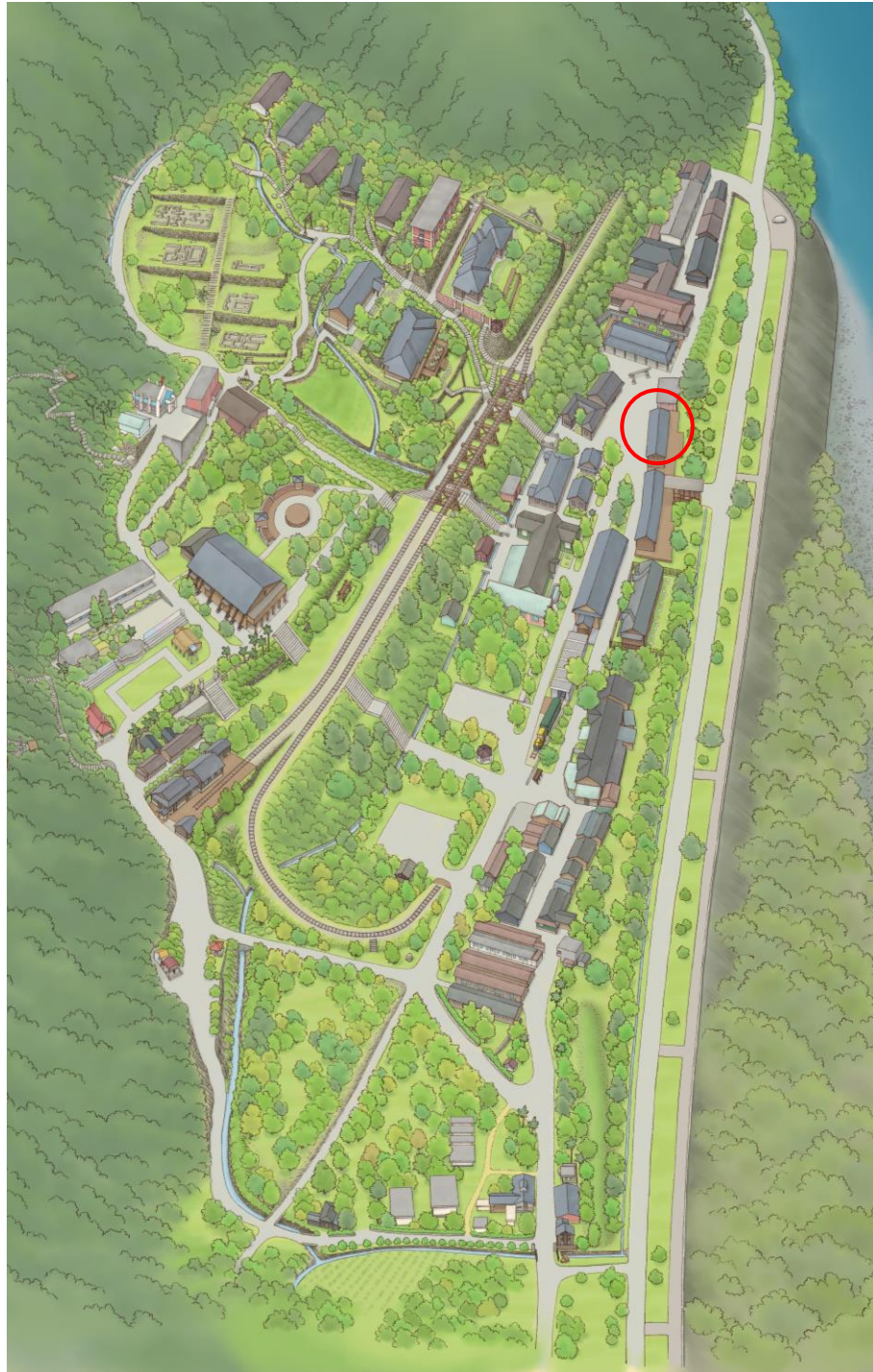
圖1. 木雕二館位置圖-紅圈標示處