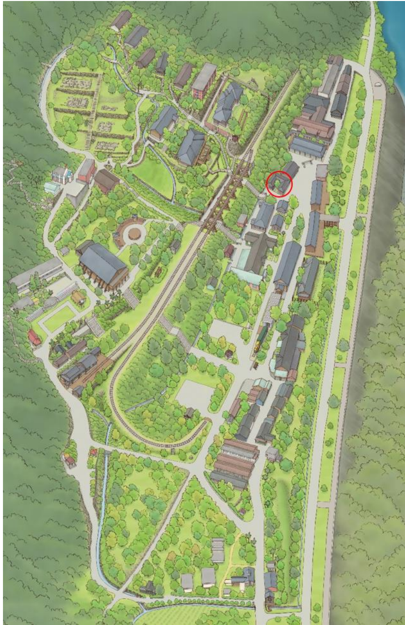
圖1.冰店位置圖-紅圈標示處