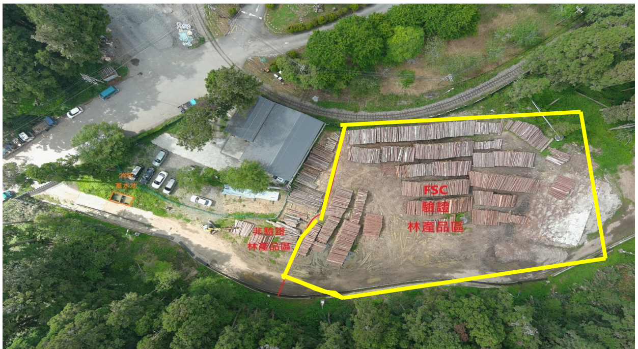
二萬坪臨時貯木場柳杉標售位置(黃色區域，以現場木材為主)