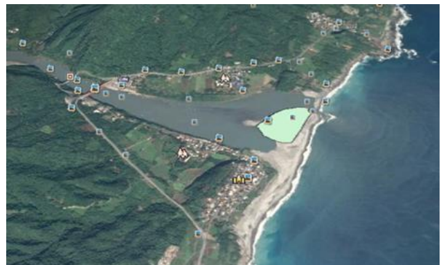
編號第 2605 號土砂捍止保安林 (秀姑巒溪出海口)