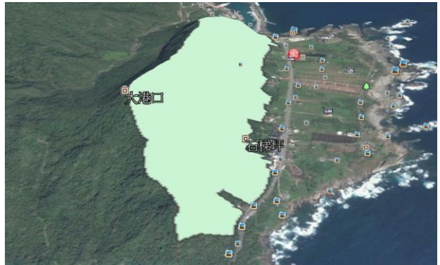
編號第 2636 號漁業保安林 (港口村)